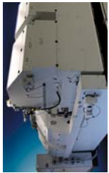
Filter ohne Filterhilfsmittel

Da Entwicklung + Planung + Fertigung + Service durch unsere erfahrenen Mitarbeiter erfolgen, können wir auf Ihre besonderen Wünsche schnell und flexible eingehen.