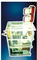
Anlage mit Chargenzentrifugen