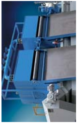
Filter mit Filterhilfsmittel